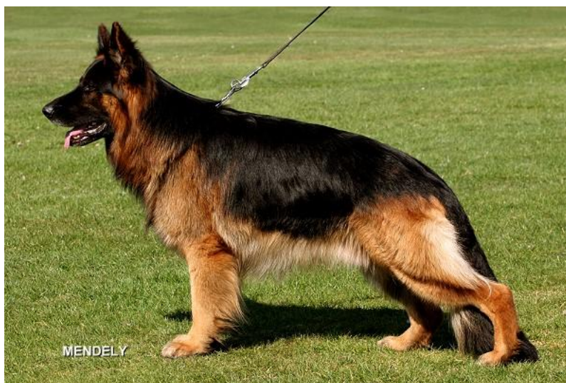
Lang og hard dekkpels