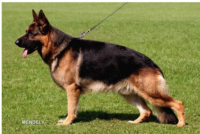
Korthåret med underull